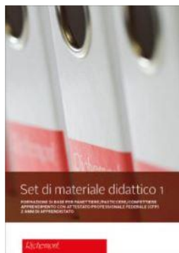
Set di materiale didattico 1 (CFP)

Prossimo passo: Torna alla homepage https://richemont.swiss Cliccare sull'icona TRASFERIMENTO DI CONOSCENZE" Trovare un set di materiale didattico adatto.