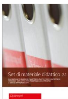
Set di materiale didattico 2.1 (AFC, Indirizzo professionale panetteria-pasticceria)